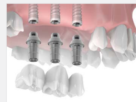
Pose d'un bridge de trois dents sur trois implants