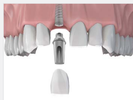
Remplacement d'une dent isolée