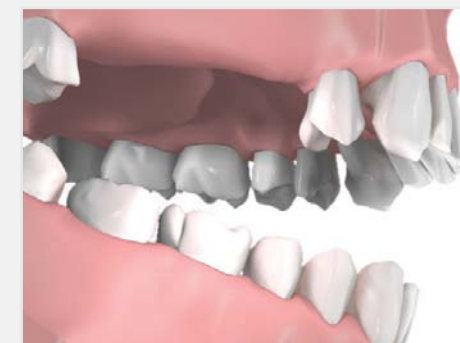
Absence de trois dents remplacées par un appareil