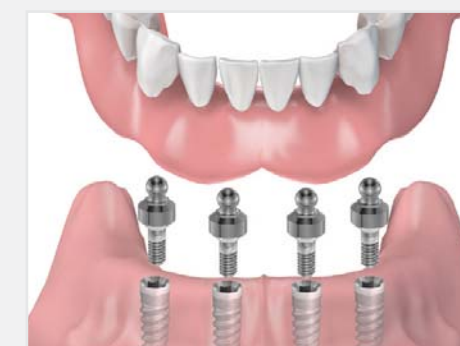
Pose de l'appareil complet sur des "attachements boule"