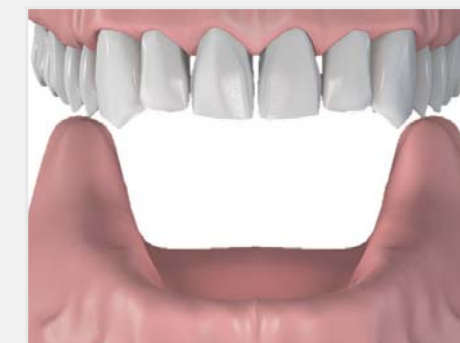
Arcade inférieure totalement édentée