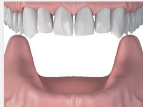
Arcade inférieure totalement édentée