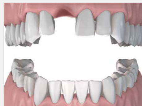
Absence d'une seule dent