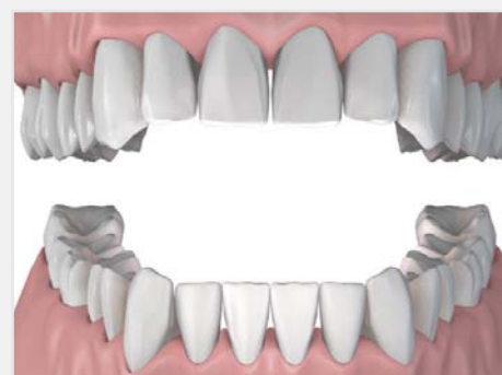
Remplacement d'une seule dent: résultat final.