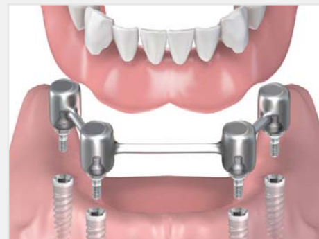
Pose de l'appareil complet sur une "Barre de Dolder"