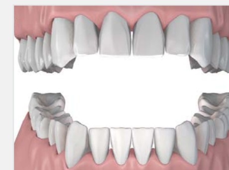
Résultat final avec les "attachements boule"