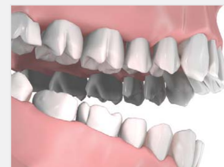
Pose d'un bridge de trois dents sur trois implants, résultat final